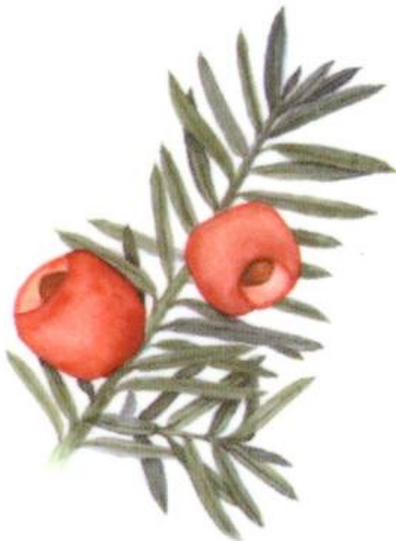
Taxus brevifolia bzw. pazifische Eibe

Die Taxane Paclitaxel und Docetaxel werden aus der Eibe gewonnen und zählen zu den wirksamsten Chemotherapeutika gegen Brustkrebs. Vor allem Patientinnen mit einem Befall der Achsellymphknoten oder besonders aggressive Tumoren ohne Befall der Achsellymphknoten profitieren. Taxane werden in der Regel in Kombination mit Anthrazyklinen verabreicht. Sie beeinflussen den so genannten Spindelapparat, der für die exakte Teilung der Krebszelle verantwortlich ist. Ausserdem schädigen sie das Erbgut und die Zellwand.